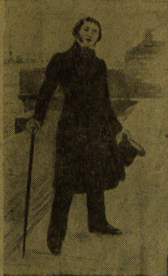
А. С. ПУШКИН на берегу Невы С картины И. Е. Репина

Петра — «суть плоды ума обширного, исполненного доброжелательства и мудрости», а его временные указы «нередко жестоки, своенравны и, кажется, писаны кнутом». Преобразования Петра были — «для будущего», а его указы — «вырвались у нетерпеливого самовластного помещика».